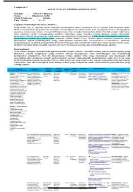
Gambar 4.2 Modul ajar SMA Negeri 1 Batang 2023 11

Berdasarkan KOSP ( Kurikulum Operasional Satuan Pendidikan ) SMA Negeri 1 Batang 2023 dalam menyusun modul ajar guru-guru di SMA Negeri 1 Batang melakukan langkah-langkah mengembangkan Modul Ajar sebagai berikut :